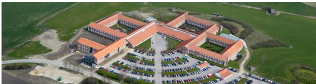
Abbildung 2: das Wissenszentrum für Landwirtschaft in Aarhus

Das „Knowledge Centre of Agriculture“ ist das sogenannte Wissenszentrum für Landwirtschaft. Dieses befindet sich in Aarhus und dient der Wissensgenerierung und Versorgung der dänischen Landwirtschaftsberatung.