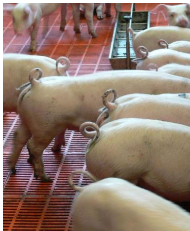
Abbildung 1: unkupierte Schwänze

Schwanz- und Ohrenbeißen ist eine komplexe Verhaltensstörung mit multifaktorieller Ursache. Daher gibt es kein allgemeingültiges Patentrezept um Schwanzbeißen zu vermeiden. Verschiedene Risikofaktoren in unterschiedlichem Ausmaß treffen in Betrieben aufeinander. Bevor ein Kupierverzicht in Betracht gezogen wird, sollten Sie Ihre betriebseigenen Risikofaktoren kennen und soweit wie möglich reduzieren. Die folgenden Schritte sollen Sie für den Weg zum Kupierverzicht vorbereiten.