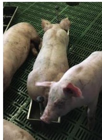
Abbildung 2: Tierbeobachtung - Liegekühlung im Trog