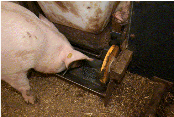
Abb. 2: Durch Beschäftigung (Drehung) mit der orangen Scheibe werden die Schweine mit einer kleinen Futtergabe „belohnt“.