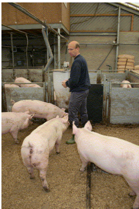
Abb. 1: Täglich verabreichte Einstreu auf planbefestigter Fläche erleichtert die Tierkontrolle und wird von den Schweinen sehr geschätzt.

Das Angebot von Beschäftigungsmaterial stellt einen Kompromiss zwischen Arbeitswirtschaft, Kosten, Hygiene und Praxistauglichkeit dar. Patentlösungen gibt es bisher nicht. So konnte auch das Schwanzbeißen durch bestimmte Beschäftigungsmaterialien nicht sicher verhindert werden.